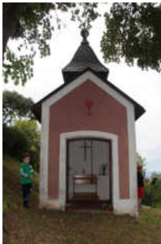
Kaple na Komárově - historie a současnost