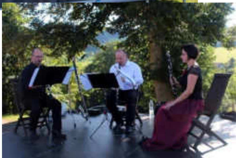
Pražské klarinetové trio →