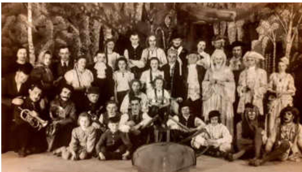
Divadelní představení „Lucerna“ 1941