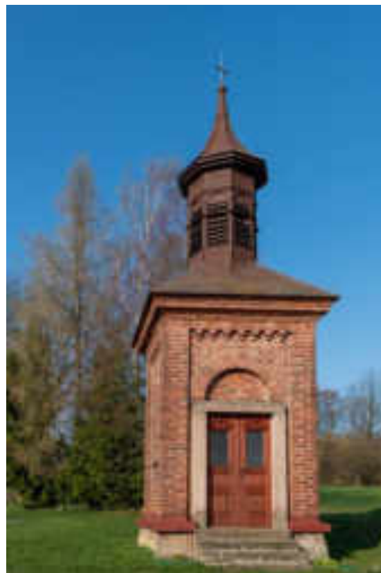
Kaple na Lhotě - historie a současnost.