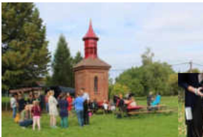
Oslava na Lhotě