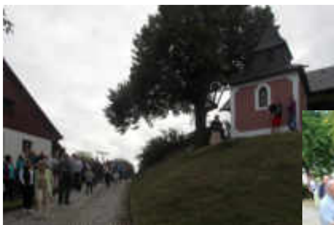
Oslava na Komárově