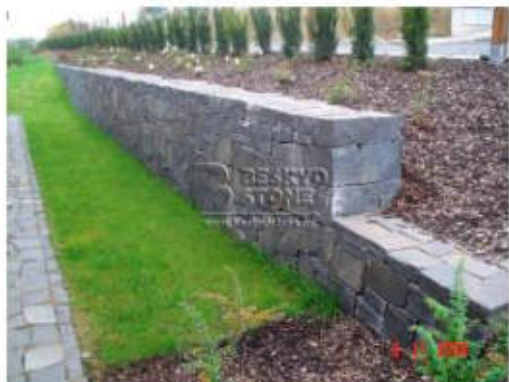
ČEDIČ - MASIV