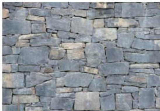
ČEDIČ - OBKLAD