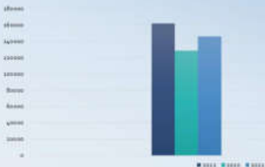
ODMĚNY Ekokomu v Kč za vytríděný odpad