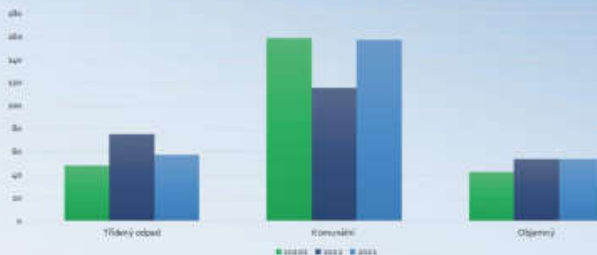
ODPADY – porovnání roku a komodity odpadu v tunách