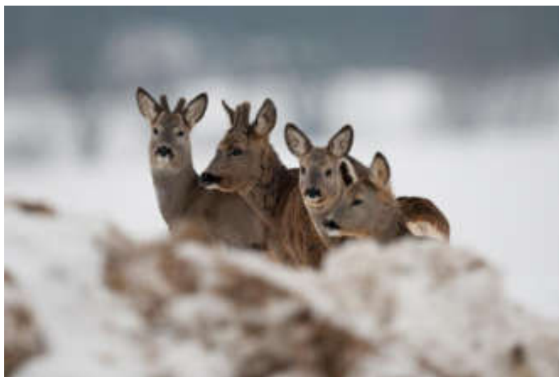
Ilustrační fotografie Richard Stehlík