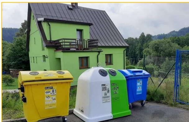
Sídliště u koupaliště