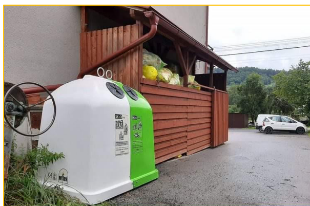
u starého obecního úřadu