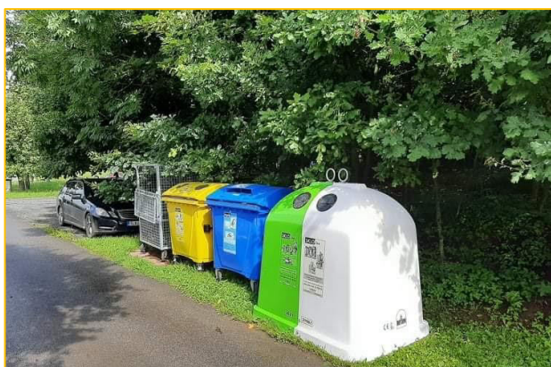
křižovatka na Slapu u č.p. 253