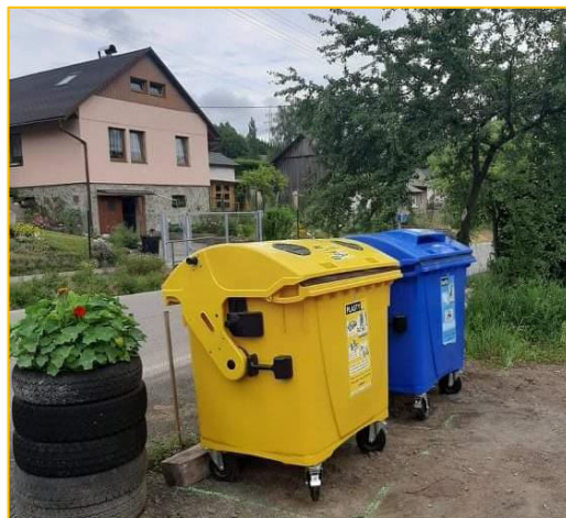
Chuchelna Dolní konec naproti č.p. 176