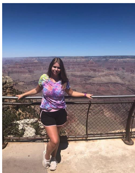
Vyhlídku na Grand Canyon