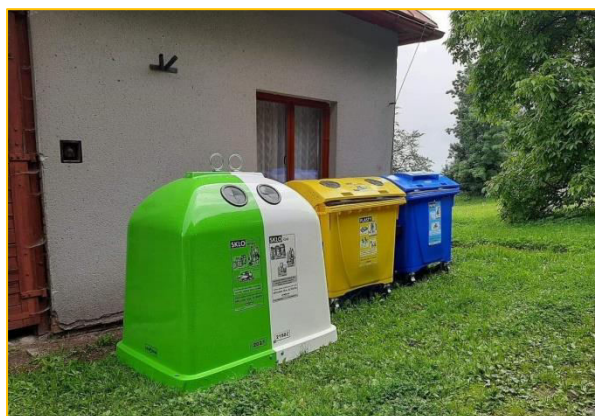
Komárov u hasičské zbrojnice