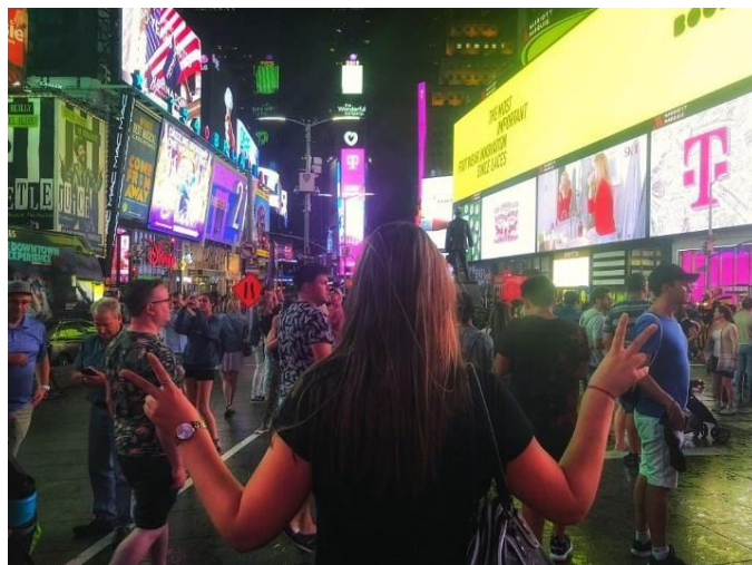
Nejznámější newyorská křižovatka Times Square

Ano, dvakrát. Nejdřív jsem přiletěla do New Yorku, kde jsem byla týden v tzv. trainingschool. Což je škola, v rámci které absolvuješ různé pohovory a školitelé tě učí jak se chovat v dané situaci, jak ji řešit, jak pracovat s malými dětmi, s teenagery, a tak dále. Odtud jsem odjela k první rodině do Connecticutu, kde to nefungovalo už od začátku. Navíc rodiče neměli moc dobré vztahy s dětmi. Což samozřejmě dopředu nezjistíš, protože když si s tou rodinou před příjezdem voláš, tak se snaží být co nejmilejší. Realita je pak trochu o něčem jiném. Tam se mi opravdu nelíbilo, takže výměna byla hodně rychlá.