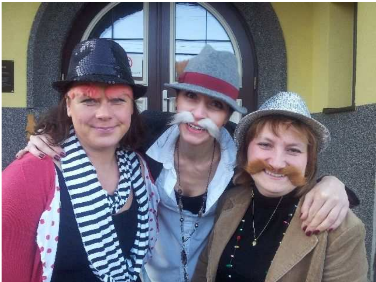
Hlavní organizátorky prosincových akcí v sokolovně – foto z dětského Silvestra